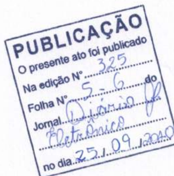
ADEMIR LUIZ MACIEL PREFEITO MUNICIPAL

Edifício da Prefeitura Municipal de Floresta, aos 25 (vinte e cinco) dias do mês de setembro do ano de 2020.