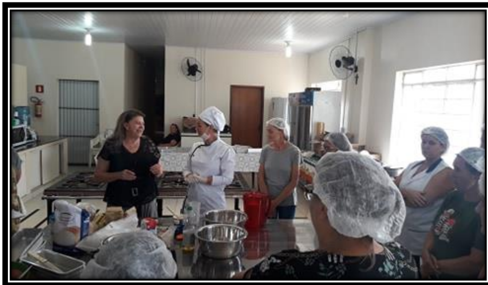
Dia de Rainha com as idosas do Serviço de Convivência e Fortalecimento de Vínculos- Em parceria com as lojas Amanda Biju e Fraan Nobrega- Fotografias. Vivenciando lindos momentos com o grupo de Idosas do Serviço de Convivência .