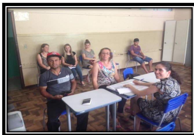
Inscrições na Escola Leopoldo Cunha para o FAR Palmital