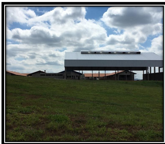
ESCOLA DE 12 SALAS DE AULAS