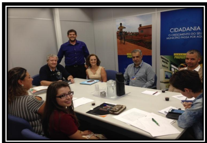
Reunião referente à proposta do FAR no distrito de Palmital