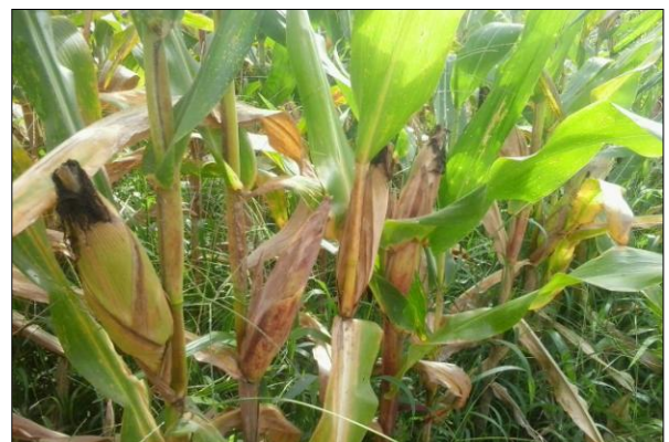
ESTÁGIO R6 (MATURAÇÃO FISIOLÓGICA)