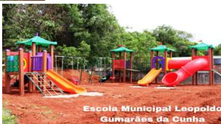
Escola Municipal Leopoldo Guimarães da Cunha