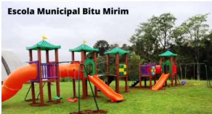
Escola Municipal Bitu Mirim

No mês de Outubro foram instalados parques infantis nas Escolas Municipais que ainda não tinham, como a Escola Municipal Bitu Mirim, Escola Municipal Cristo Rei, Escola Municipal Leopoldo Guimarães da Cunha e Escola Municipal Madre Josafata. Os parques foram adquiridos por meio de licitação Pregão Eletrônico 121/2021, foram licitados 02 modelos de parque, 01 para o infantil e 01 para o fundamental. O parque infantil teve um valor de R$ 7.950,00 (sete mil novecentos e cinquenta reais) cada e o fundamental teve um valor de R$ 14.885,00 (quatorze mil oitocentos e oitenta e cinco reais) totalizando um investimento de R$ 91.340,00 (noventa e um mil e trezentos e quarenta reais).