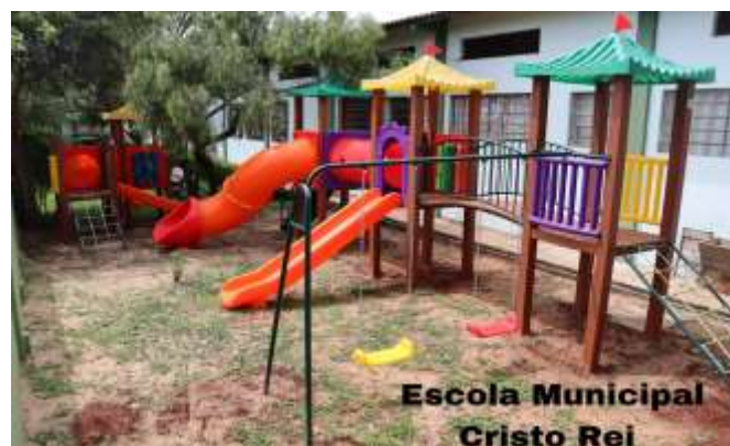
Escola Municipal Cristo Rei