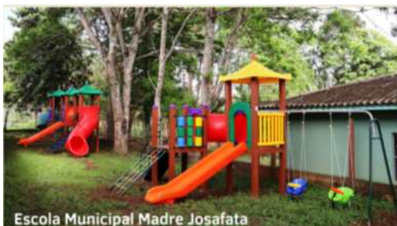
Escola Municipal Madre Josafata