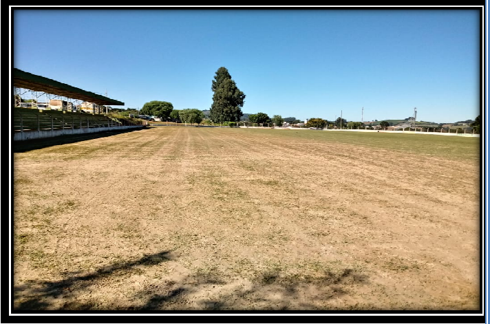
✚ FUTSAL Masculino e Feminino